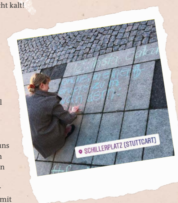
LENA JASCHKOWITZ, DH-STUDENTIN AN DER KJG-DIÖZESANSTELLE

16:45 Uhr | Kaputt und glücklich mache ich mich auf den Weg zur S-Bahn. Ich bin froh, dass ich dazu beitragen konnte, die Ereignisse betroffener Personen sichtbar gemacht zu haben und bin gespannt, was ich bei weiteren Ankreiden-Touren erleben werde.